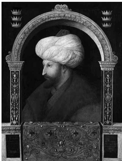
Sultan Mehmed II. wird neben Osman I. wegen seiner zahlreichen Eroberungen (Konstantinopel 1453) als zweiter Begründer des Osmanischen Reiches betrachtet (Porträt 1480 von Gentile Bellini, Viktoria and Albert Museum, London).

1. Gabriele Annas konnte bis Ende des Jahres den ersten Teilband von Band 20 der „Deutschen Reichstagsakten, Ältere Reihe“: „Die Reichsversammlungen der Jahre 1455-1458“ so weit für den Druck vorbereiten, dass er im ersten Halbjahr 2026 erscheinen kann. Im unmittelbaren Anschluss an die drei sogenannten Türkenreichstage in Regensburg, Frankfurt am Main und Wiener Neustadt (1454/55) (Band 19/2 und 19/3, beide 2013) wurden in den Jahren 1455 bis 1458 in Frankfurt am Main und Nürnberg in dichter Folge mehrheitlich kurfürstliche Versammlungen abgehalten, die sich den zentralen reichspolitischen Themen jener Zeit widmeten.