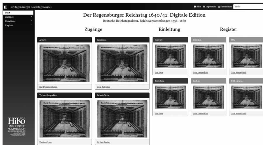
Startseite der geplanten digitalen Edition.

sonstige Korrespondenz, Gutachten und Sachverhaltsdarstellungen bis hin zu Diarien und Supplikationen, Truppenaufstellungslisten, Rechnungen oder Druckschriften. Sie alle werden, soweit erhalten, in den Archiven der Reichstagsteilnehmer und damit in zahlreichen im Regelfall staatlichen bzw. städtischen Archiven in mehreren europäischen Ländern aufbewahrt, in denen das Material für die Edition erhoben werden muss. Der Reichstag bestand aus einer Kette von Sitzungen und weiteren Treffen bzw. Veranstaltungen, für die Protokolle vorliegen. Mit der sogenannten Diktatur, der von der Kanzlei des Mainzer Kurfürsten als Reichstagskanzlei organisierten Vervielfältigung für die akkreditierten Delegationen der Reichsstände, hatte sich ein zeitgenössisches System herausgebildet, das aus Schriftstücken gewissermaßen offizielle Verhandlungsakten machte. Die digitale Edition bietet deswegen neben den edierten Texten zusätzlich drei weitere Zugänge zum Reichstagsgeschehen von 1640/41 an.