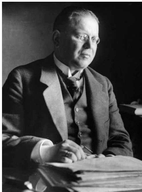
Matthias Erzberger (1875-1921) im Jahr 1919.