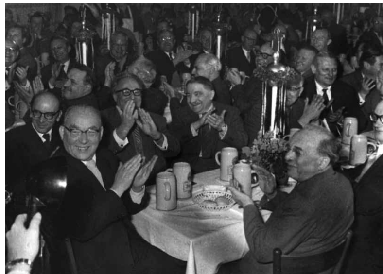
Das Foto zeigt das Kabinett Hoegner II 1956 bei der Salvator-Probe in der Fastenzeit im Paulaner am Nockherberg in München. Dies geht seit 1891 mit der Tradition des „Derbleckens“ einher, Spottliedern bzw. -versen, die heute primär der Politik gelten. Auf dem Foto unten links am Tischrand Ministerpräsident Wilhelm Hoegner (SPD), ihm vis-a-vis der stellvertretende Ministerpräsident Joseph Baumgartner (Bayernpartei).

Durch das digitale Angebot der HiKo liegt nunmehr eine erstrangige wissenschaftliche Quelle für die Jahre 1945 bis 1955 vor. Gleichzeitig wird damit das Regierungshandeln im Freistaat Bayern im ersten Nachkriegsjahrzehnt für jedermann nachvollziehbar. Diese Transparenz gehört zum Wesenskern demokratischer Gemeinwesen.