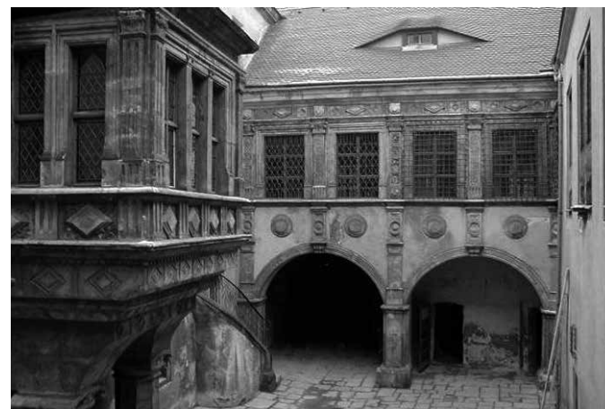
Stadtarchiv Görlitz, Untermarkt 6-8.