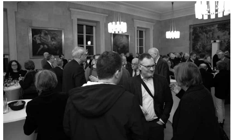
Empfang in der Bayerischen Akademie der Wissenschaften am 5. März 2025 anlässlich der Jahresversammlung.

Klar ist schon jetzt: Der Wert quellenkritisch zuverlässiger, wissenschaftlicher digitaler Editionen und historisch-biographischer Lexikonartikel der HiKo wird in Zeiten von kompilierten Chatbot-Antworten z.B. auf Google sowie Fake News eher noch steigen. Anders als die auf den ersten Blick praktischen, aber von ausländischen Konzernen kontrollierten und auf Sprachmodellen basierenden Zusammenfassungen, die Fakten und Urteile volatil und zusammenhanglos bieten, ermöglichen es die Editionen und historisch-biographischen Artikel der HiKo, sich selbst ein kritisches Urteil zu bilden; sie sichern außerdem transparente und methodisch verlässliche Verfahren. Unabhängig kuratierte verlässliche Informationsquellen sind damit ein wirksamer Schutz vor Populismus und gesellschaftlicher Spaltung. Die HiKo ist sich der gewachsenen gesellschaftlichen Bedeutung ihrer Arbeit in polarisierten Zeiten bewusst und wird daher in Zukunft unter anderem die Kooperation mit den Einrichtungen der politischen Bildung suchen. KI betrachtet die HiKo im Übrigen nicht per se als gefährlich; sie kann durchaus produktiv eingesetzt werden (z.B. im Bereich von NDB-online); ein unreflektierter Umgang mit ihr ist jedoch problematisch.