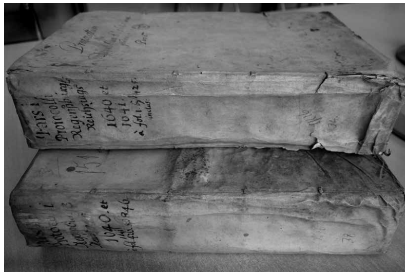
Mainzer Kurfürstenratsprotokoll, Bände 1 und 2: Österreichisches Staatsarchiv, Abt. Haus-, Hof- und Staatsarchiv = AT-OeStA/HHStA, MEA RTA 151.

Proposition bis zur Verabschiedung der Reichsstände stattfanden“, in edierten Texten sichtbar zu machen, ist seit ihrer Gründung das Hauptziel der Abteilung Reichsversammlungen . 10 Dokumentiert sind diese Verhandlungen insbesondere in den Protokollen der Kurien- und sonstigen Beratungen sowie in Positionspapieren und Regelungsentwürfen, die innerhalb und zwischen den Kurien diskutiert und zwischen Kaiser und Reichsständen ausgetauscht wurden: Sie alle gehören zu den editionswürdigen Materialien und wurden in den bisherigen Editionen der Reihe prinzipiell vollzählig ediert, wobei bei einzelnen Stücken Kürzungen, Zusammenfassungen und Aktenreferate eingesetzt wurden. Protokolle und Papiere aus dem Verhandlungsgang wird auch die digitale Edition für den Reichstag von 1640/41 als edierte Texte zur Verfügung stellen. Der Anspruch auf Vollzähligkeit allerdings lässt sich angesichts der Quellsituation nicht aufrechterhalten. Statt alle unmittelbar zu den Verhandlungen gehörenden Dokumente wird nur eine Auswahl davon präsentiert werden können.