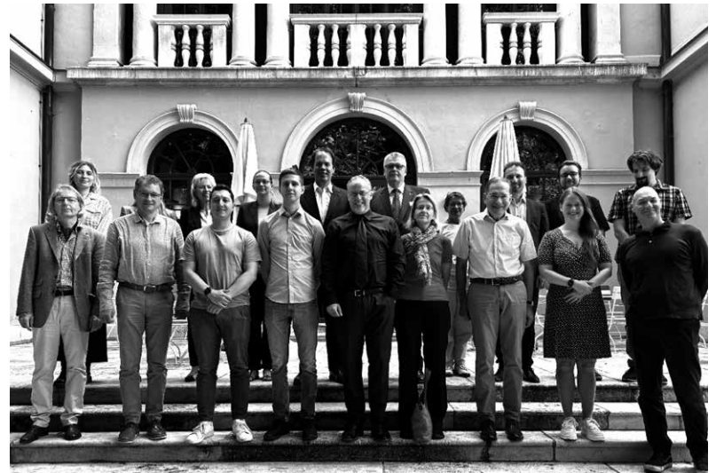
Die Teilnehmerinnen und Teilnehmer der Tagung „Edieren im digitalen Zeitalter“ im Juli 2025 auf der Terrasse des Historischen Kollegs in München.