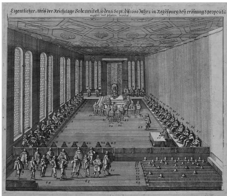
Eigentlicher Abriß der Reichstags Solennitet, so den 3/13 Sept. diß 1640 Jahrs in Regensburg bey eröffnug & proposition/angestellt und gehalten worden, 1640 (Ausschnitt). Kulturstiftung Sachsen-Anhalt – Kunstmuseum Moritzburg (Halle), Flugblattsammlung 16.–19. Jahrhundert, MOIIF00222a. https://st.museum-digital.de/object/107556 (22.02.2026).