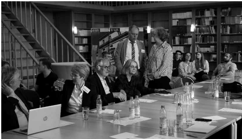
Abschlussstagung zum Projekt „Abgeordnetenleben 1871-1918. Die sozialen und kulturellen Grundlagen parlamentarischer Repräsentation. Die digitale Korrespondenz von Reichstagsabgeordneten mit ihren Ehefrauen“ am 21./22. Mai 2025 in der Bibliothek der Bayerischen Akademie der Wissenschaften.